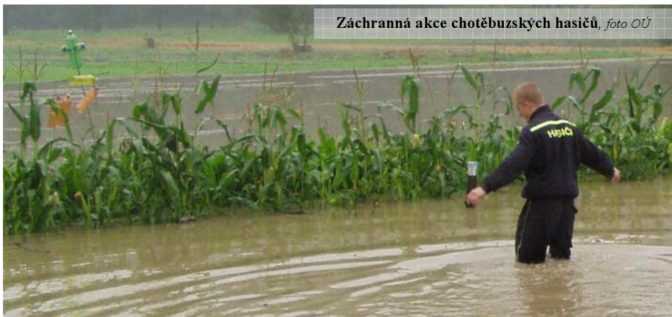
Záchranná akce chotěbuzských hasičů