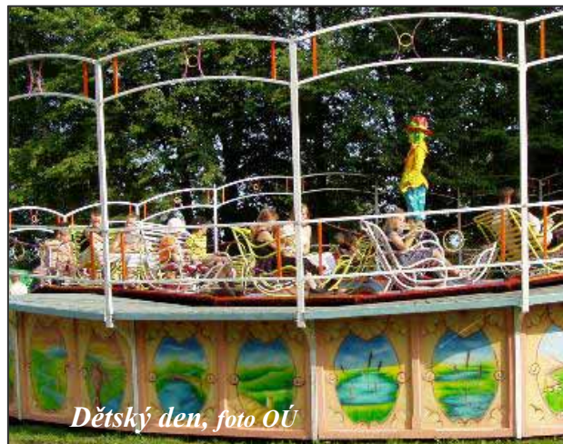
Dětský den